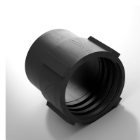
Combiflex Manchette PU EL à visser Embout en PU pour les tuyaux Master-PUR L/H et Master-PVC L/H, conducteur d'électricité