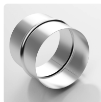
Manchon de raccordement Manchon de raccordement en acier galvanisé pour tuyaux et gaines légers ou lourds