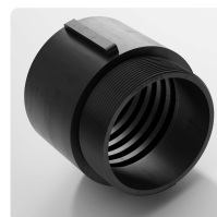
Embout fileté PU Combiflex Embout fileté pour tous les types de tuyaux Master-PUR L, Master-PUR H et Master-PUR HX, basé sur la norme DIN ISO 228